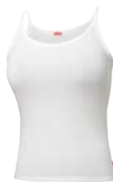
Lady Strap Top

Bara under 2009 köpte svenska folket över 8 miljoner par strumpor och underkläder från idrottsföreningar och skolklasser. Här ser du några av dem.