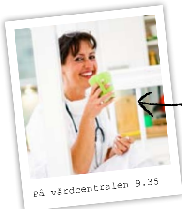
På vårdcentralen 9.35