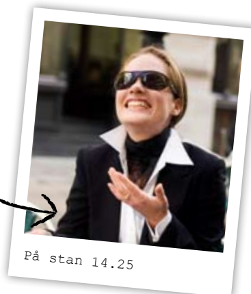
På stan 14.25