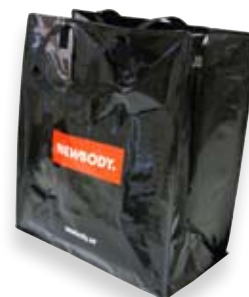
Visningskassen innehåller ett axplock ur vårt sortiment.

Antingen står kontaktpersonen (som måste vara 18 år) som betalningsansvarig, eller så borgar föreningen för försäljningen med sitt organisationsnummer. Newbody gör en anmärkningskontroll.